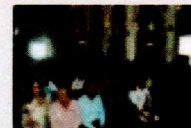
Galería Fotos de la Misa del 82 aniversario de la fundación de la Policía Nacional SPM